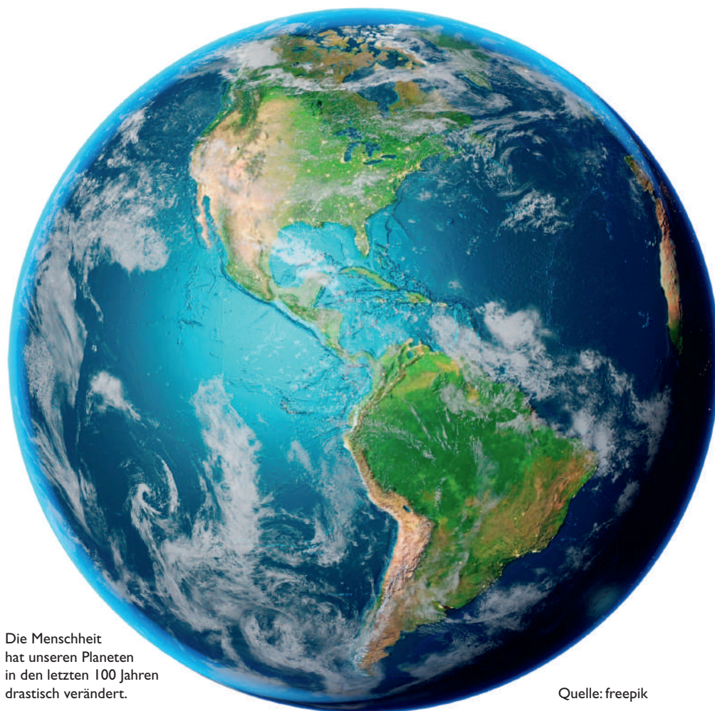
Die Menschheit hat unseren Planeten in den letzten 100 Jahren drastisch verändert.

Darüber hinaus gibt es eine moralische Scham, die abstrakter ist und körperlich weniger spürbar, zum Beispiel die Flugscham. Wir fliegen, obwohl wir wissen,