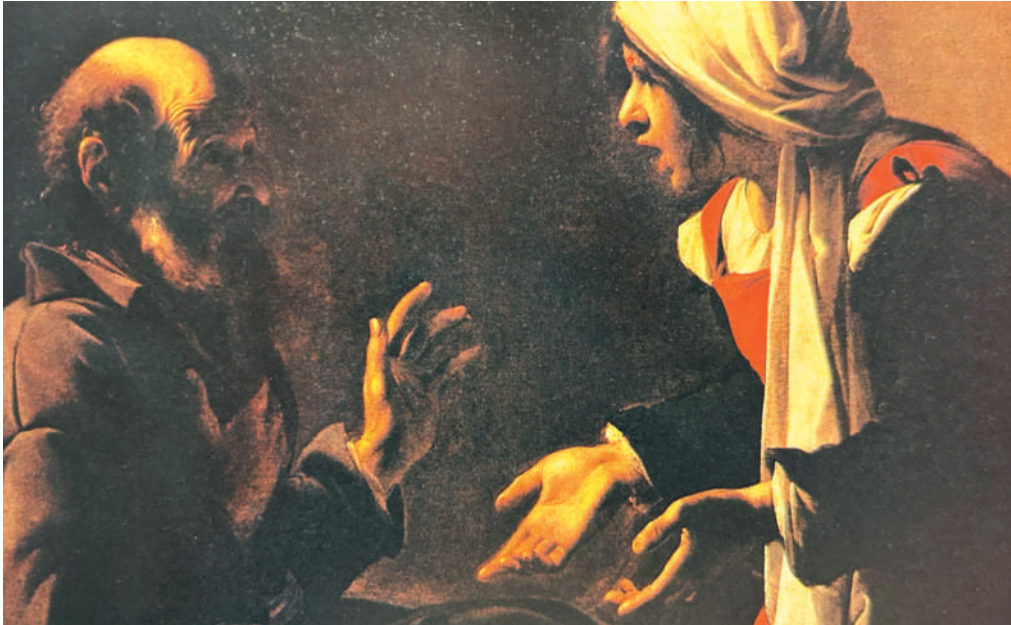
Petrus verleugnet Christus,