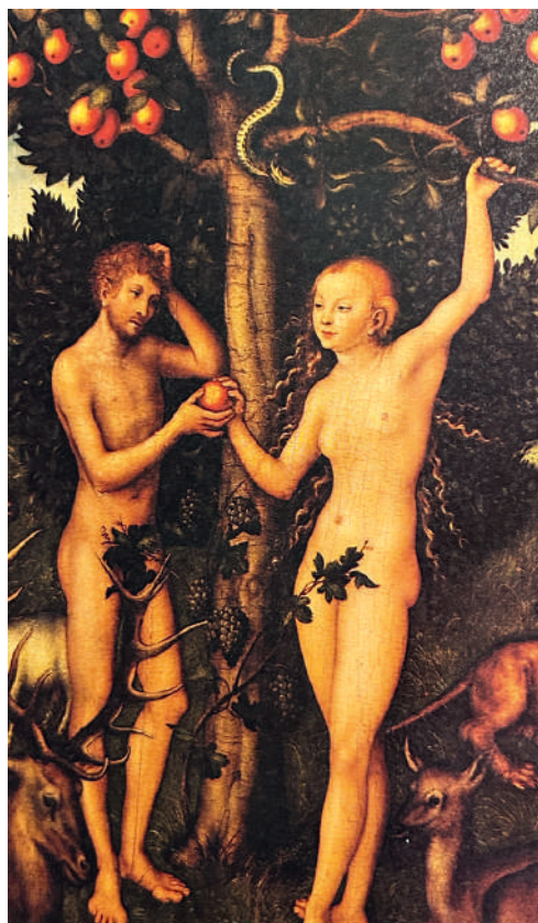
Der Sündenfall erzählt von der Entstehung der Scham.

Der Psalmist erfährt die sich über Zeit und Raum erstreckende Allgegenwart