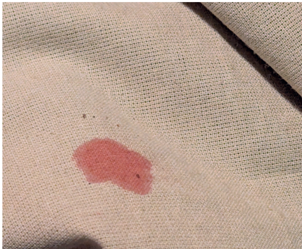
Ein Rotweinfleck kann einem unangenehm sein.

sind und damit verstehen sie, dass sie zwei unterschiedliche Menschen sind. Damit treten sie in eine neue Entwicklungsstufe ein und erkennen das Problem der Grenzen. Vorher lebten sie innig verschmolzen in der Geborgenheit des Paradieses. Nun aber schämen sie sich, weil sie erkennen, wer sie selbst sind, grundverschieden, mit eigenen Möglichkeiten, aber auch Schwächen und Begrenzungen. Im Neuen Testament ist Petrus ein gutes Beispiel für einen positiven Umgang mit Scham. Drei Mal behauptet Petrus, Jesus nicht zu kennen. Als er erkennt, dass er weniger mutig ist als angenommen, sinkt seine Selbstachtung und die Scham ist gross. Und dennoch wird Petrus später eine der wichtigsten Figuren in der Nachfolge Jesu. Schmerzliche Einsichten können auch dazu verhelfen, mit den eigenen Schattenseiten aufrecht weiterzugehen. Das gelingt am ehesten, wenn wir Menschen an unserer Seite haben, die mit Taktgefühl und Humor unsere Schwächen sehen und uns dennoch unterstützen.