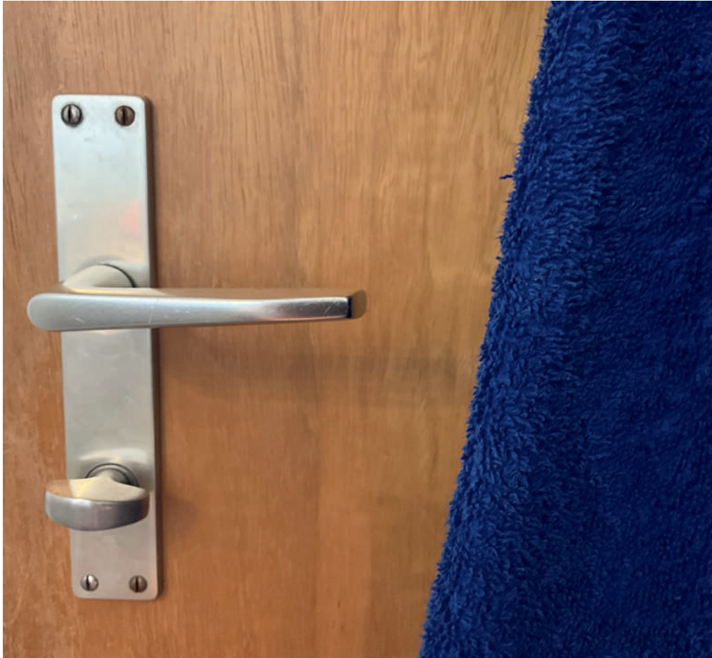
Schloss an Badezimmertür: Eine Schamspur.