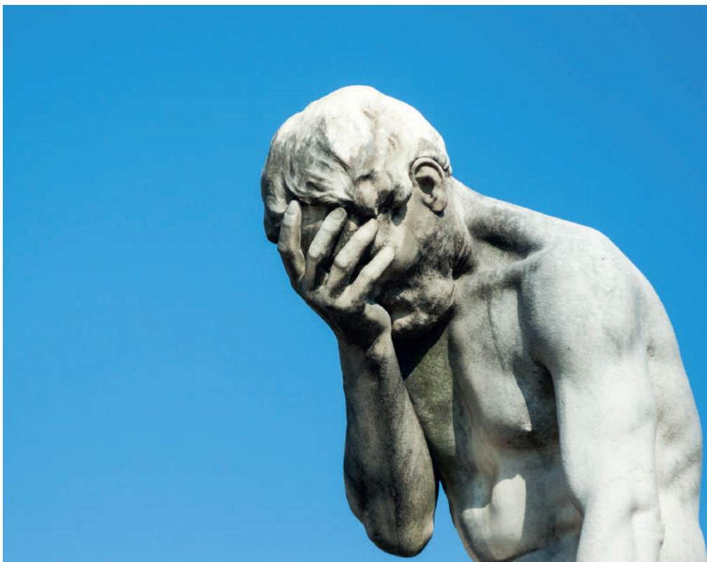
Kain nach dem Brudermord an Abel – Henri Vidal hat diese Scham in den Tuileries (Paris) vor fast 130 Jahren in Stein gemeisselt.

So wird die Scham bezeichnet, bei welcher man sich für eine andere Person schämt, welche nicht der eigenen Gruppe entspricht. Normalerweise ist dies ein Phänomen, das vorübergehend im Teenageralter auftritt gegenüber den eigenen Eltern, die dann «peinlich» sind. Was eine normale pubertäre Entwicklung ist, kann tiefer gehen, wenn Eltern ernsthafte Probleme haben (Sucht, Gewalttätigkeit, Armut, psychisch krank). Wenn wir mit einer Person gesehen werden, die nicht gesellschaftskonform oder nicht konform