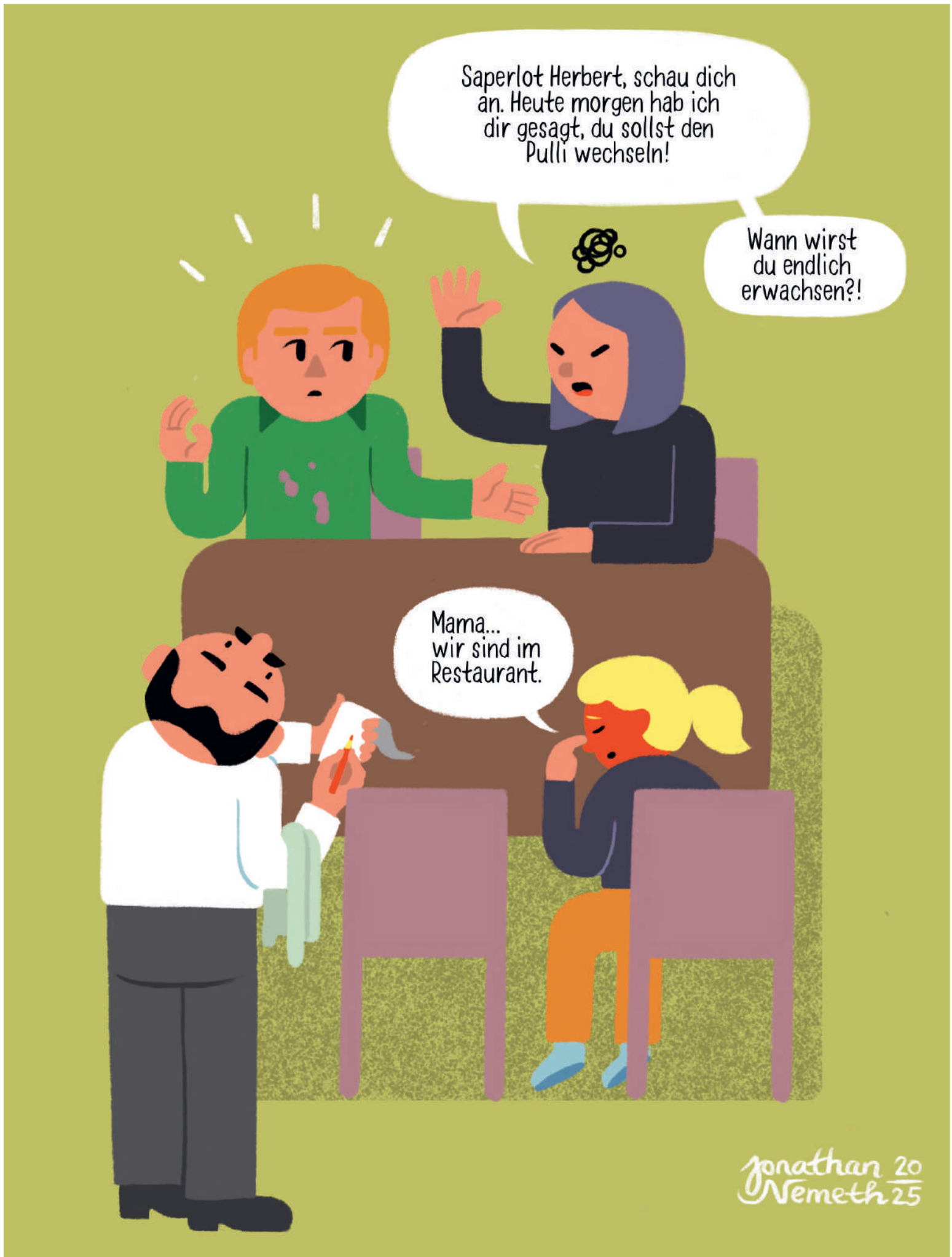
Illustration: Jonathan Németh