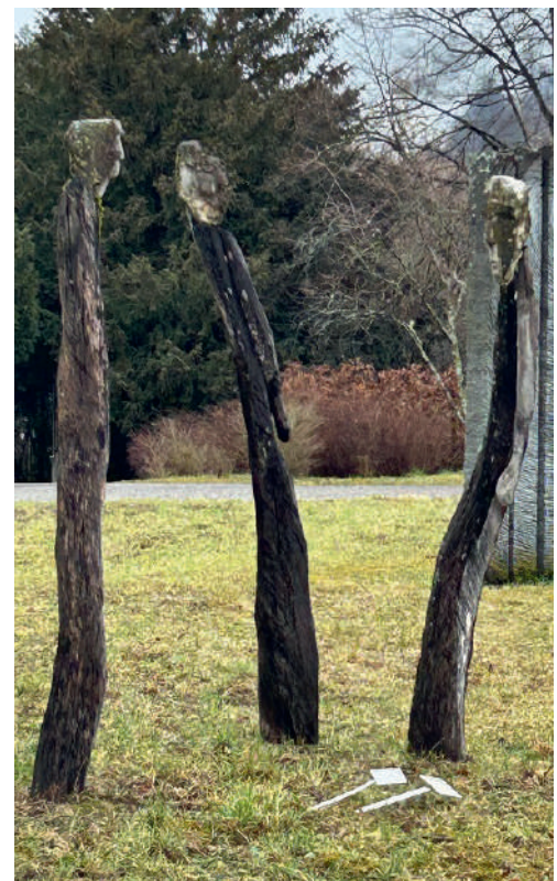
«Blicke»: Skulptur von Sabine Gysin auf dem Gelände der Psychiatrischen Klinik Liestal.

Wunderbar sind deine Werke, das erkennt meine Seele.»