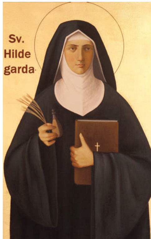
Hildegard von Bingen in der Tracht der Benediktinerinnen. Alle Haare sind «unter der Haube», die symbolische Art, eine Nonne als Braut Christi zu kennzeichnen und zugleich eine Erinnerungsspur an die biblisch-orientalische Verbindung von entblösstem Haar und Scham.

Wie bereits im Wort enthalten, geht es bei dieser Scham um die Wahrung der eigenen körperlichen und seelischen Intimitätsgrenzen. Welche körperlichen Grenzen als intim gelten, ist kulturell unterschiedlich definiert. Das Gebot zur Bedeckung der Kopfhaare der Frau in einem Gottesdienst (1. Kor 11,6) lag an der damaligen und bis heute im Vorderen Orient gültigen Verbindung der Erotik und Intimität mit den Haaren der Frau. Obwohl die Intimitätsscham des weiblichen Haares in anderen Weltgegenden nicht mehr gilt, haben sich die religiösen Gebote im orthodoxen Judentum sowie im Islam weltweit gehalten, sowie in Kopfbedeckungen von Nonnen und Diakonissen. Intimitätsscham erfahren wir auf körperlicher Ebene durch Verletzung der eigenen Würde oder auf seelischer Ebene durch öffentliche verbale Demütigung (Trump und Vance gegen Selensky), Mobbing, Herabgesetztwerden oder Nichtbeachtung. Wenn wir früh Verletzungen der Intimitätsscham